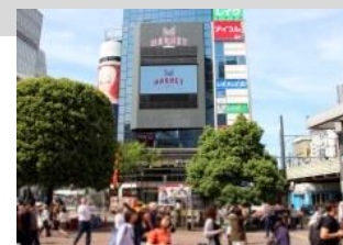
放映開始(月曜スタート)